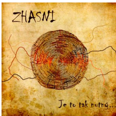
CD Je to tak nutný... 179,-Kč