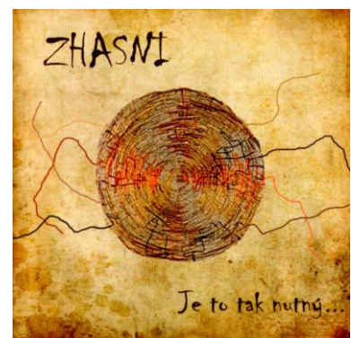
CD Zhasni Je to tak nutný 179,-