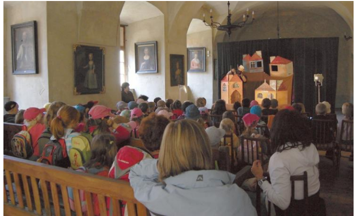
Divadlo Matýsek na hradě Grabštejn