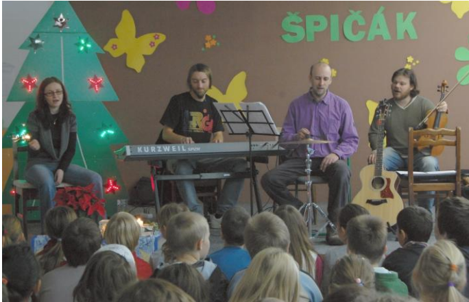
Vánoční písně a koledy 2012